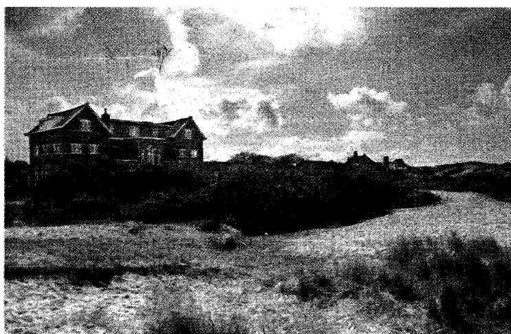
Schilders werken in Zandvoort aan Zee aan een straattekening en het Natuurvriendenhuis in Bergen aan Zee.