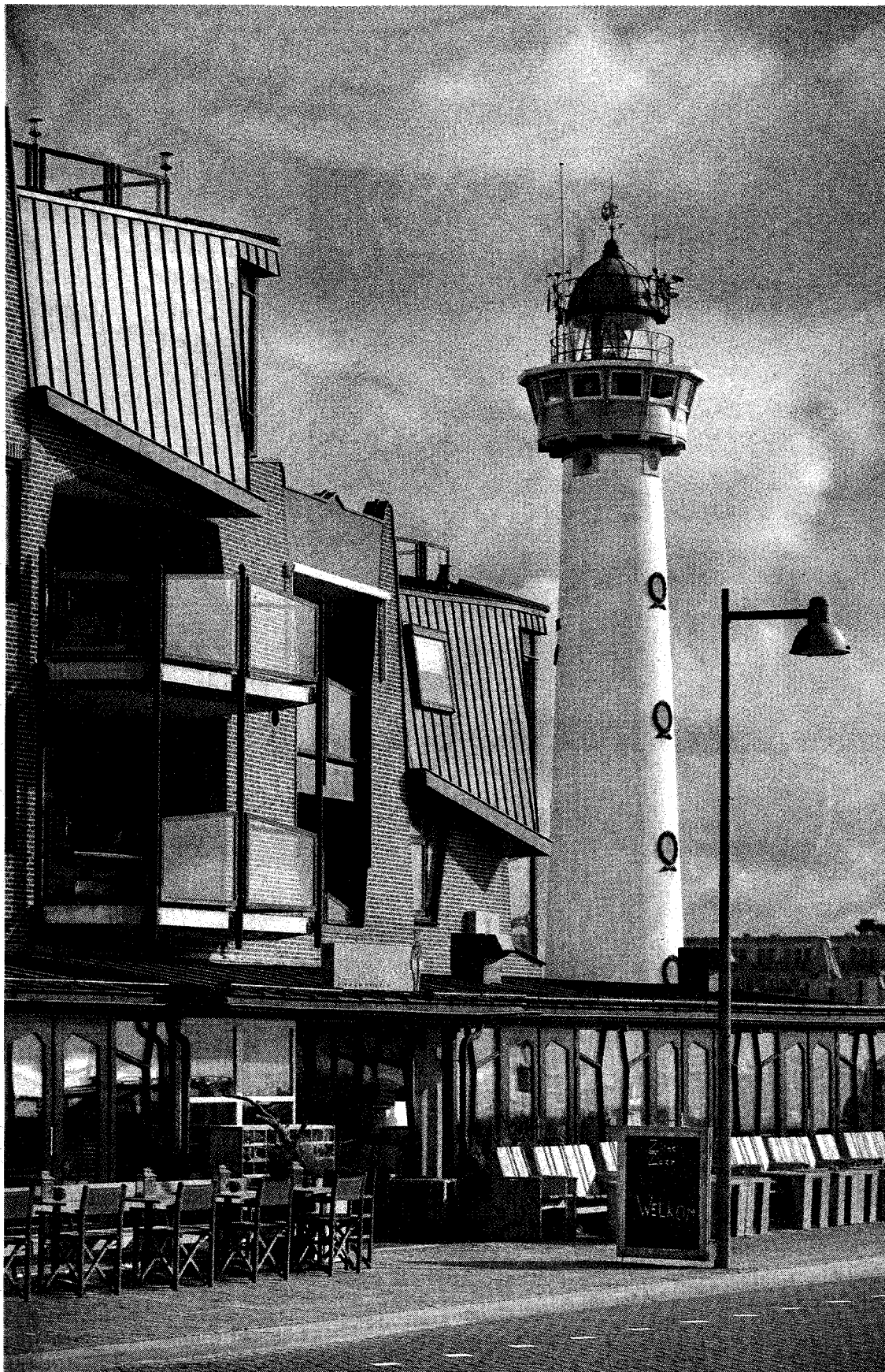
De monumentale vuurtoren van Egmond aan Zee en een ernaast gelegen hotel.